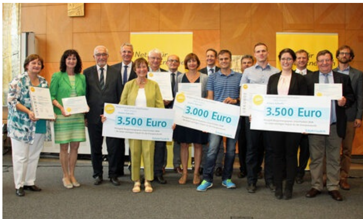
Die Gewinner des Bürgerenergiepreises Unterfranken 2018 bei der Preisverleihung.

Die Teilnahmebedingungen, der Bewerbungsbogen und Videos der Vorjahressieger sind im Internet unter www.bayernwerk.de/buergerenergiepreis zu finden. Der vollständig ausgefüllte Bewerbungsbogen kann zusammen mit Fotos und ergänzenden Unterlagen (max. 10 DIN A 4-Seiten) bis zum 22. Juli 2019 bei der Bayernwerk Netz GmbH, Ursula Schmitt, Unterdürrbacher Straße 14-22, 97080 Würzburg, eingereicht werden. Die Gewinner werden durch eine Fachjury benannt, die auch die Höhe des Preisgeldes festlegt. Bei Fragen zum Bewerbungsverfahren können sich alle Interessierten an die Projektverantwortliche des Bayernwerks, Annette Seidel, Tel.: 0921 - 2 85 20 82, Buergerenergiepreis@Bayernwerk.de , wenden.